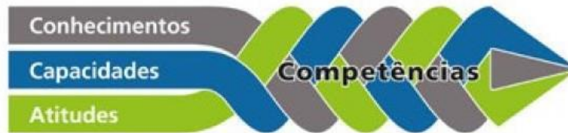
Figura 2 – Esquema conceitual de competência adaptado de “The Future of Education and Skills: OECD Education 2030 Framework”, In: Global competency for an inclusive world , OECD, 2016.

Os descritores e/ou os indicadores de aprendizagem têm por finalidade avaliar as áreas de competência – combinações complexas de conhecimentos, capacidades e atitudes, fundamentais para o perfil dos alunos à saída da escolaridade obrigatória.