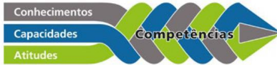
Figura 2 – Esquema conceitual de competência adaptado de “The Future of Education and Skills: OECD Education 2030 Framework”, In: Global competency for an inclusive world , OECD, 2016.